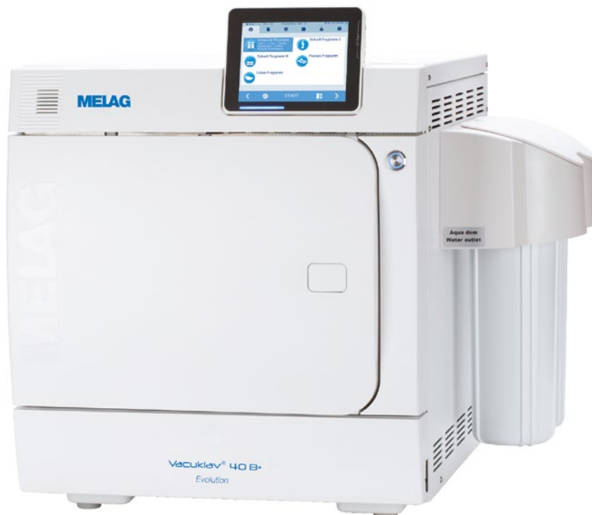
Vacuklav40B+ Evolution mit seitlich angebrachter MELAdem40

Sparen Sie Zeit und Geld, das Sie für das Beschaffen, Transportieren, Lagern und Einfüllen des destillierten oder demineralisierten Wassers in Ihren Autoklaven benötigen, indem Sie Ihren Vacuklav an eine Wasser-Aufbereitungsanlage anschließen. Wenn sich in der Nähe des Autoklaven ein Wasserzu- und Wasserablauf befindet, automatisieren Sie nicht nur die Befüllung und Dosierung, sondern auch den Abfluss des verwendeten Wassers. Von der kleinen praktischen MELAdem40 über die besonders wirtschaftliche und umweltfreundliche Umkehr-Osmose-Anlage MELAdem47 bis zur Hochleistungs-Anlage MELAdem53 (für den gleichzeitigen Anschluss eines Themodesinfektors) bieten wir hier für jeden gewünschten Einsatz die passende Lösung.